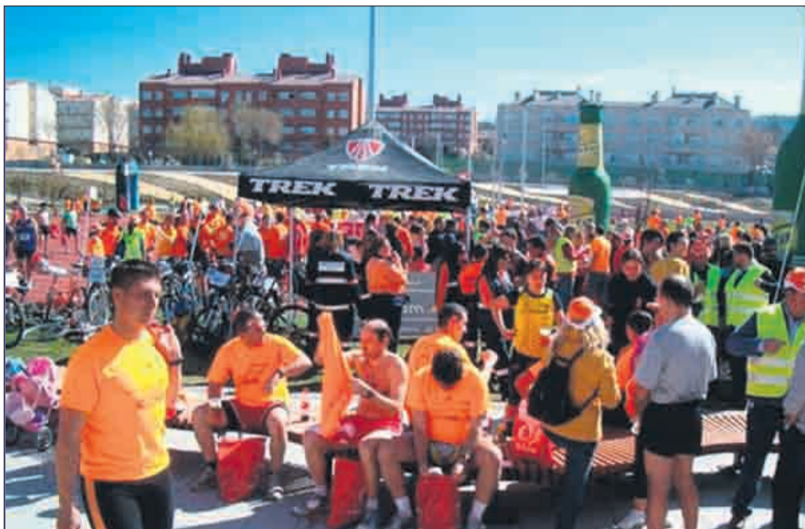
Imagen del movimiento en meta de la edición del pasado año

tualmente de todo cuanto acontezca en carrera. El punto culminante llegará con la entrega de premios, al filo de las 13:00 horas. Como es tradicional, el ganador se llevará un jamón de bellota y un teléfono móvil de última generación valorado en 500 euros. Esa cifra será la que se lleve el ganador masculino si baja de 1:08 horas, y la campeona femenina, si registra menos de 1:14. Todo ello estimando al máximo 40.000 euros.